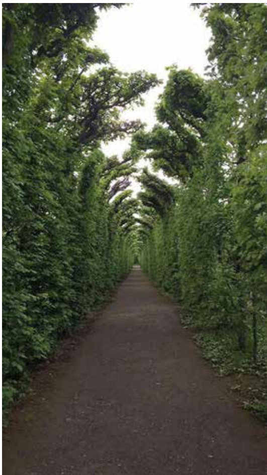
Schönbrunnin linnan puisto