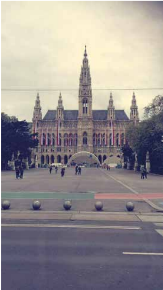
Wienin ratikkakerrokselta (raatihuone)