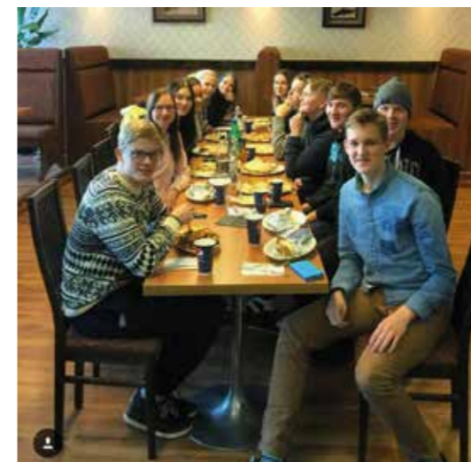
Uusi ja vanha hallitus.